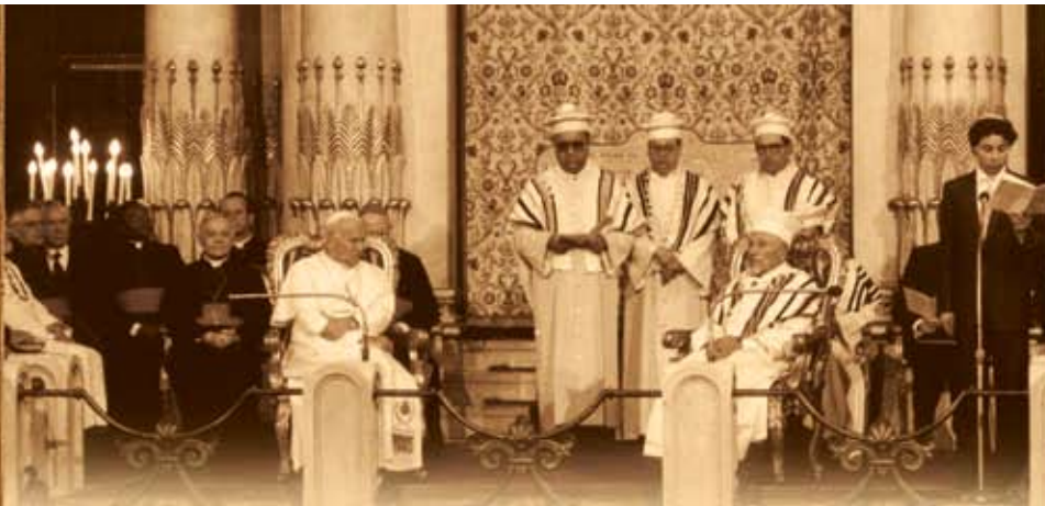
Pope John Paul II in the Synagogue of Rome with Rabbi Elio Toaff - 1986

In numerose occasioni, condannò l'antisemitismo e, in una riunione con i vescovi di America Latina, li ha sollecitati a combattere con valore qualsiasi segnale di antisemitismo. "L'antisemitismo è un peccato; è anticristiano".