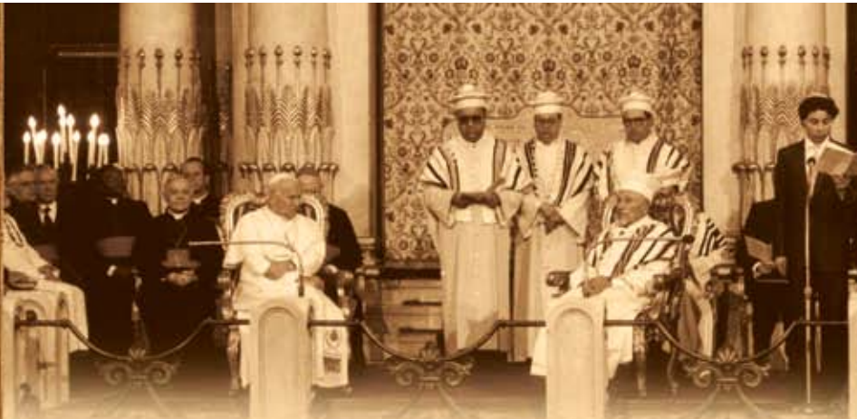
Papst Johannes Paul II begrüßt Rabbi Elio Toaff am Eingang der Synagoge in Rom - 1986

Demütig bat der Papst um Vergebung für die Grauen, die Christen denen zugefügt hatten, die er "unsere älteren Brüder im Glauben" nannte. Er veranlasste auch, dass im Vatikan ein eigenes Konzert zum Gedenken der sechs Millionen jüdischen Holocaust-Opfer gegeben wurde. Außerdem besuchte er das Konzentrationslager in Auschwitz in Polen.