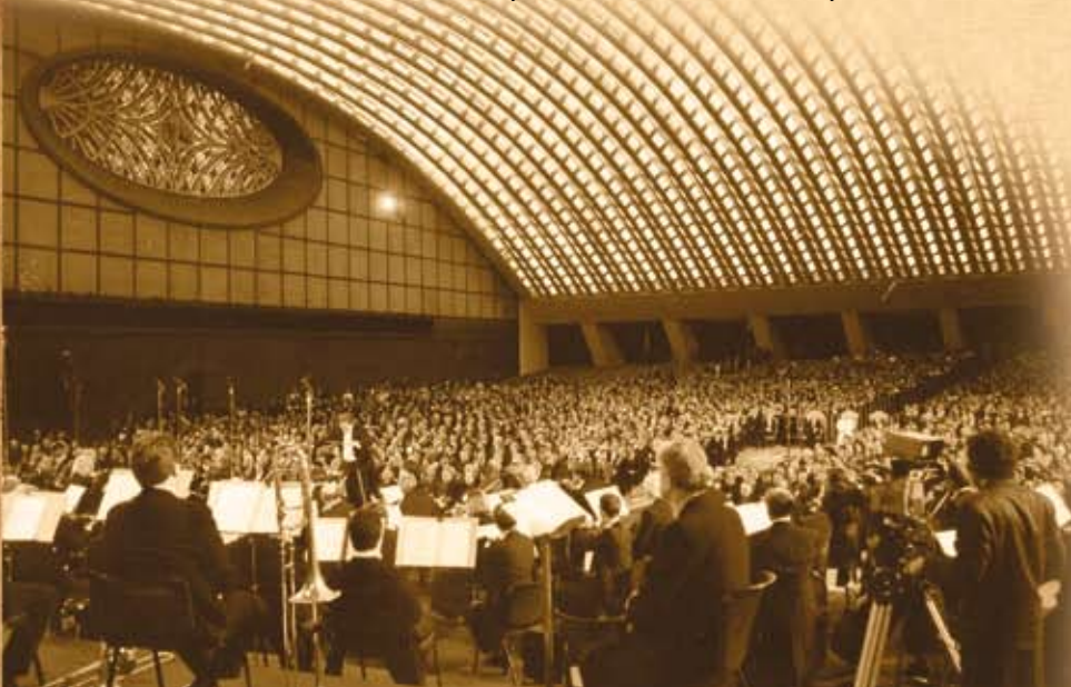
Holocaust Memorial Concert at the Vatican in memory of the 6 million Jews exterminated by the Nazis - 1994

“我們祖先的天主，A禱選了亞巴郎和他的子孫來將禱的聖t名帶給所有的民族。我們為那些世代以來令禱的子女受苦的人的行為而深深悲痛，為此，我們祈求禱的寬e恕；也願意勉力與和禱締結盟約的人民（猶太人民）建立真誠的兄弟情誼。”教宗這些話以及這些話在基督信徒和猶太人之間所搭的橋，影響的確無限深遠廣大。他的訊息是給所有的基督信徒的：弟兄姐妹們，我們中許多人行為令人羞愧。我們沒有以我們的新盟約來恢復猶太人民的身份。