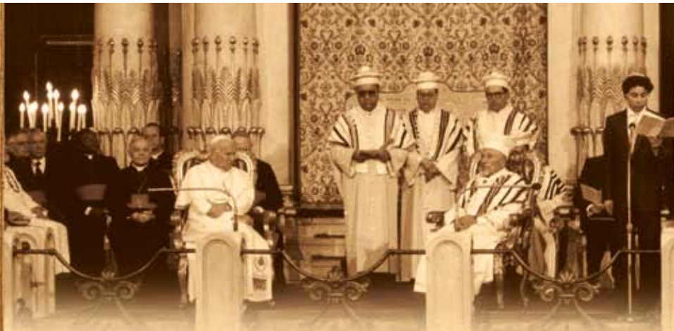
Pope John Paul II in the Synagogue of Rome with Rabbi Elio Toaff – 1986

我們的“長兄長姐們”繼續擁有一個特殊的盟約，一個與天主的盟約。猶太人回到以色列他們祖先的家鄉。我們因世代以來迫害他們而犯了罪。這些深刻的話語形成了卡洛·沃伊蒂瓦，敬愛的教宗若望保祿二世@這位偉大的靈魂的主要遺教之一。