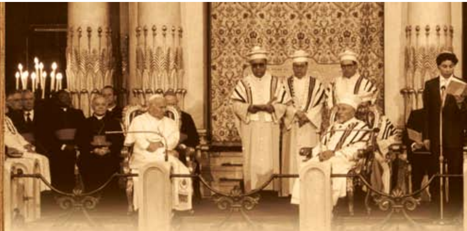
Juan Pablo II en la Sinagoga de Roma con el Rabino Elio Toaff- 1986.

EL ALCANCE DE ESTAS PALABRAS, EL PUENTE QUE ELAS TIENDEN ENTRE CRISTIANOS Y JUDÍOS...ES INMENSO. ESTE MENSAJE ESTÁ DIRIGIDO A TODOS LOS CRISTIANOS: HERMANOS Y HERMANAS, MUCHOS DE NOSOTROS NOS HEMOS PORTADO INDIGNAMENTE. NO HEMOS REEMPLAZADO A LOS JUDÍOS CON NUESTRA NUEVA ALIANZA. NUESTROS "HERMANOS Y HERMANAS MAYORES" CONTINUÁN SIENDO POSEEDORES DE UN VÍNCULO ESPECIAL, UNA ALIANZA CON EL SEÑOR. LOS JUDÍOS HAN REGRESADO A SU PATRIA ANCESTRAL, ISRAEL. HEMOS PECADO EN PERSEGUIRLOS A TRAVÉS DE LOS SIGLOS. ESTAS PROFUNDAS PALABRAS CONSTITUYEN UNO DE LOS PRINCIPALES LEGADOS DE ESA GRAN ALMA QUE FUE KAROL WOJTYLA, EL BIEN AMADO PAPA JUAN PABLO II.