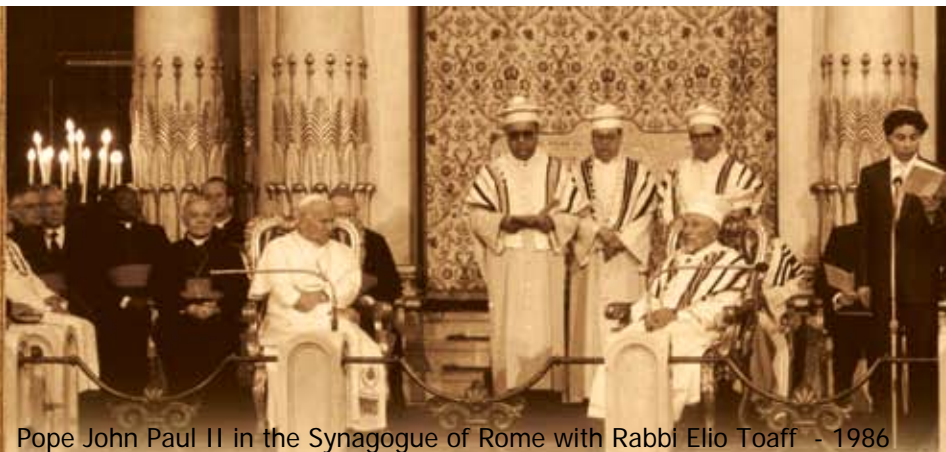
Pope John Paul II in the Synagogue of Rome with Rabbi Elio Toaff - 1986

Dans sa prière, Jan Paul II a dit: « Dieu de nos pères, Tu as choisi Abraham et sa descendance pour porter le nom de Dieu à toutes les nations. Nous sommes profondément tristes pour le comportement de ceux qui, dans l'histoire, ont provoqué la souffrance à tes fils, c'est pour ce la que on invoque ton pardon. Nous désirons nous engager dans la réalisation d'une vraie fraternité avec le peuple de l'Alliance (le peuple juif). Le retentissement de ces paroles a jeté le pont entre chrétiens et juifs, ce qui réalise un très important résultat. Le Pape conclut disant que ce message, s'adresse a tout les chrétiens : «Chers frères et sœurs, beaucoup de nous, se sont indignement comportés. Nous n'avons pas remplacé l'Alliance du peuple juif avec la nôtre. Nos « grands frères et sœurs » continuent à avoir une liaison spéciale, une Alliance avec le Seigneur. Les juifs sont retournés à leur patrie ancestrale, Israël. Nous avons péché en les persécutant durant les siècles ». Ces mots profonds constituent un des principales héritage de la grande âme que fut Karol Wojtyla, le bien aimé Pape Jean Paul II.